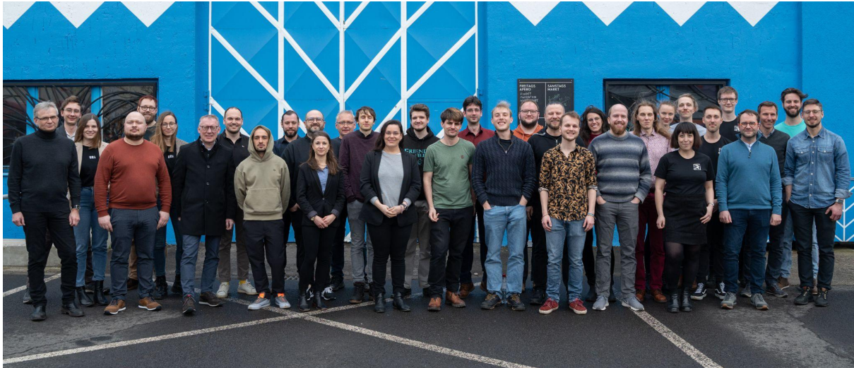
(, Gruppenbild der R42 Partner, Start-ups und dem R42 Team - *Namen am Ende der PM)